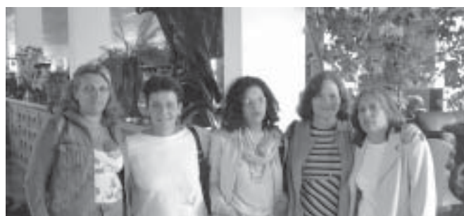
Integrantes da Comissão Organizadora e de Apoio durante visita ao hotel-fazenda em Serra Negra, que possui infra-estrutura e beleza natural incomparáveis.

para identificar datas, horários e locais de chegada, bem como as necessidades de transporte e situações especiais.